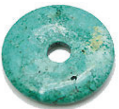
NAME : TOURQUISE 商品名: トルコ石 (カラー) NATURAL / 天然石 (カラー)

SIZE / サイズ 15MM. 20MM. 25MM. 30MM. 35MM. 40MM. 45MM. 50MM.