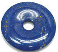
NAME : LAPIS LAZURI AB 商品名: ラピスラズリ AB NATURAL / 天然石 AB

SIZE / サイズ 15MM. 20MM. 25MM. 30MM. 35MM. 40MM. 45MM. 50MM.