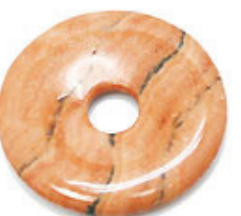
NAME : PICTUER JASPER 商品名: ピクチャージャスパー NATURAL / 天然石

SIZE / サイズ 15MM. 20MM. 25MM. 30MM. 35MM. 40MM. 45MM. 50MM.