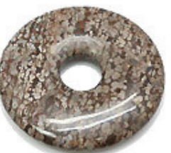
NAME : LEOPARD SKIN 商品名: レオパードスキン NATURAL / 天然石

SIZE / サイズ 15MM. 20MM. 25MM. 30MM. 35MM. 40MM. 45MM. 50MM.