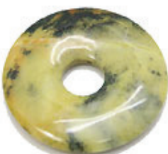
NAME : TOURQUISE (YEL) 商品名: トルコ石 (黄) NATURAL / 天然石

SIZE / サイズ 15MM. 20MM. 25MM. 30MM. 35MM. 40MM. 45MM. 50MM.