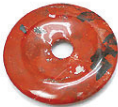
NAME : RED JASPER 商品名: レッドジャスパー NATURAL / 天然石

SIZE / サイズ 15MM. 20MM. 25MM. 30MM. 35MM. 40MM. 45MM. 50MM.