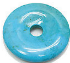
NAME : TOURQUISE 商品名: トルコ石 SINTETIC / 合成カラー

SIZE / サイズ 15MM. 20MM. 25MM. 30MM. 35MM. 40MM. 45MM. 50MM.