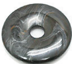
NAME : TYGER IRON 商品名: タイガーアイロン NATURAL / 天然石

SIZE / サイズ 15MM. 20MM. 25MM. 30MM. 35MM. 40MM. 45MM. 50MM.