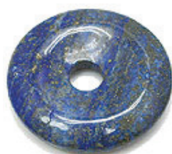
NAME : LAPIS LAZURI A 商品名: ラピスラズリ A NATURAL / 天然石

SIZE / サイズ 15MM. 20MM. 25MM. 30MM. 35MM. 40MM. 45MM. 50MM.