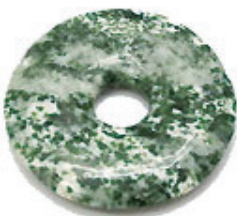
NAME : MOSS AGATE AB 商品名: モスアゲット AB NATURAL / 天然石

SIZE / サイズ 15MM. 20MM. 25MM. 30MM. 35MM. 40MM. 45MM. 50MM.