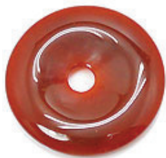
NAME : RED AGATE 商品名: レッドアゲット NATURAL / 天然石