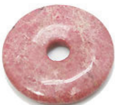
NAME : RHODONITE A 商品名: ロードナイト A NATURAL / 天然石

SIZE / サイズ 15MM. 20MM. 25MM. 30MM. 35MM. 40MM. 45MM. 50MM.