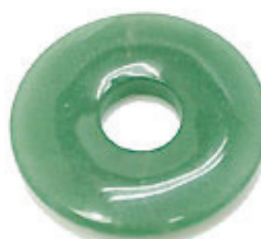
NAME : AVENTRINE 商品名: アベンチュリン NATURAL / 天然石

SIZE / サイズ 15MM. 20MM. 25MM. 30MM. 35MM. 40MM. 45MM. 50MM.