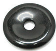
NAME : BLACK AGATE 商品名: ブラックアゲット NATURAL / 天然石

SIZE / サイズ 15MM. 20MM. 25MM. 30MM. 35MM. 40MM. 45MM. 50MM.