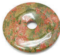
NAME : UNAKITE 商品名: ユナカイト NATURAL / 天然石

SIZE / サイズ 15MM. 20MM. 25MM. 30MM. 35MM. 40MM. 45MM. 50MM.