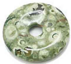
NAME : RYOLITE 商品名: リョライト NATURAL / 天然石

SIZE / サイズ 15MM. 20MM. 25MM. 30MM. 35MM. 40MM. 45MM. 50MM.