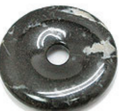
NAME : SNOW FLAKE AB 商品名: スノーフレイク AB NATURAL / 天然石

SIZE / サイズ 15MM. 20MM. 25MM. 30MM. 35MM. 40MM. 45MM. 50MM.