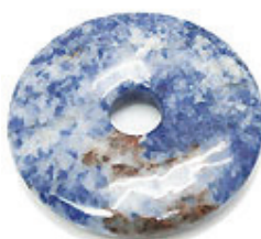
NAME : SODALITE 商品名: ソーダライト NATURAL / 天然石

SIZE / サイズ 15MM. 20MM. 25MM. 30MM. 35MM. 40MM. 45MM. 50MM.