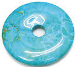
NAME : HOW LITE 商品名: ハウライト SYNTETIC / 合成石

SIZE / サイズ 15MM. 20MM. 25MM. 30MM. 35MM. 40MM. 45MM. 50MM.