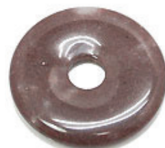
NAME : RHODONITE AB 商品名: ロードナイト AB NATURAL / 天然石

SIZE / サイズ 15MM. 20MM. 25MM. 30MM. 35MM. 40MM. 45MM. 50MM.